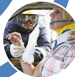
ACCIDENTE DE AUTO